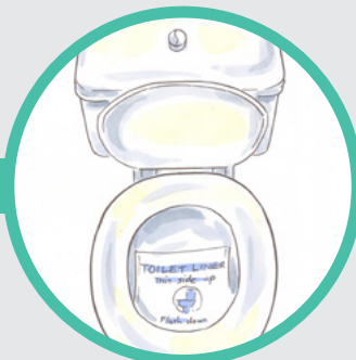
3. 将衬垫放入便池内。