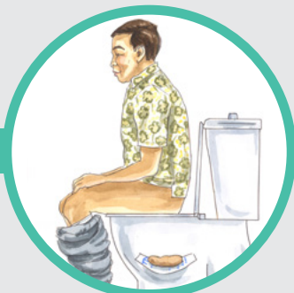
3. 再次排便， 第二只试管重复同样操作。