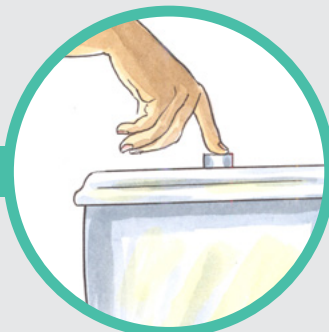
2. 排一次尿并冲厕所。