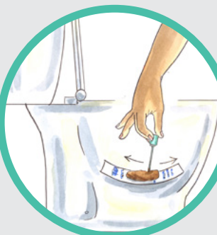
3. 用取样棒刮擦粪便。